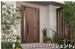
リフォームドア「リシェント」