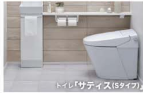
トイレ「サテイス(Sタイプ)」